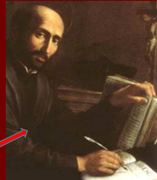
Ignác z Loyoly