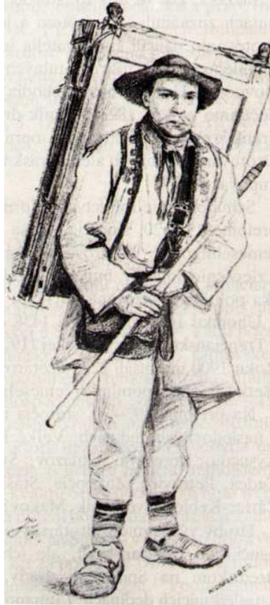
Múzeum drotárstva v Budatínskom zámku v Žiline