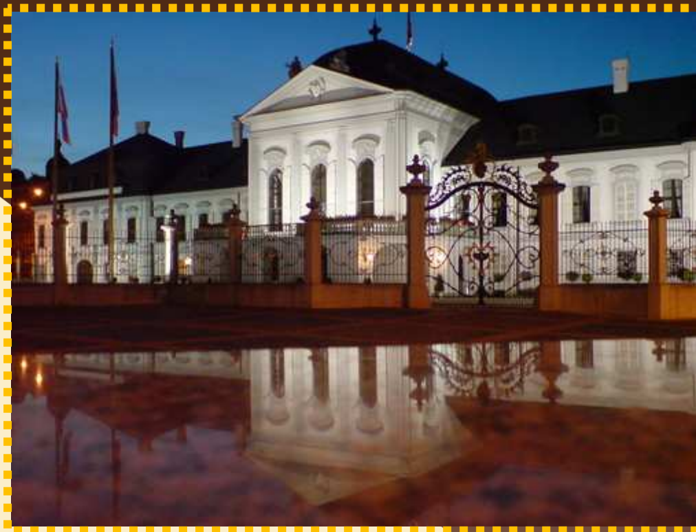
Grasalkovičov palác známy ako Prezidentský palác