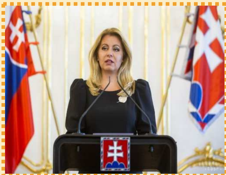
Prezident SR Zuzana Čaputová