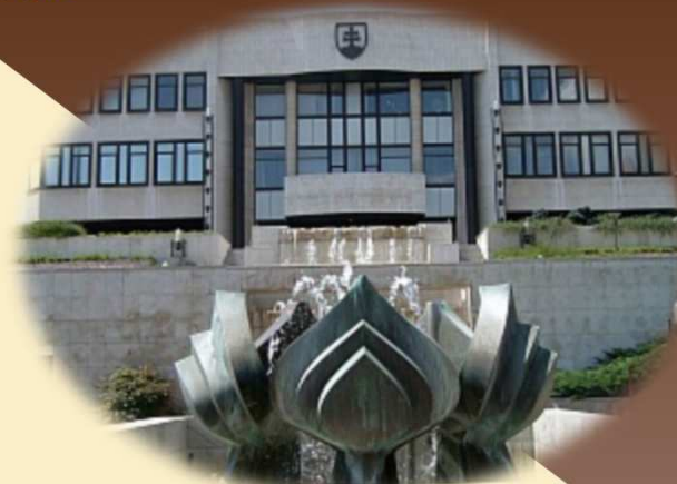
Budova NR SR