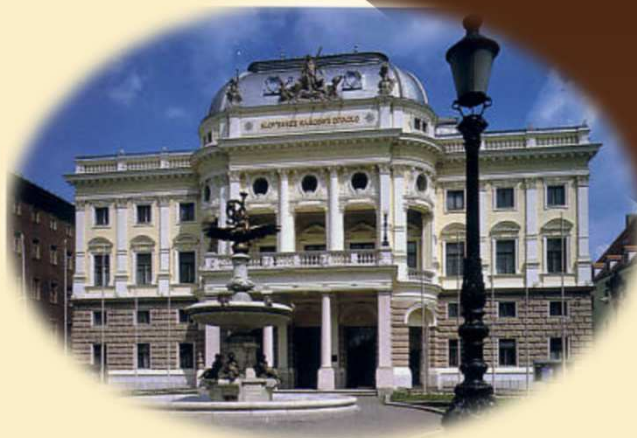
Slovenské Národné Divadlo