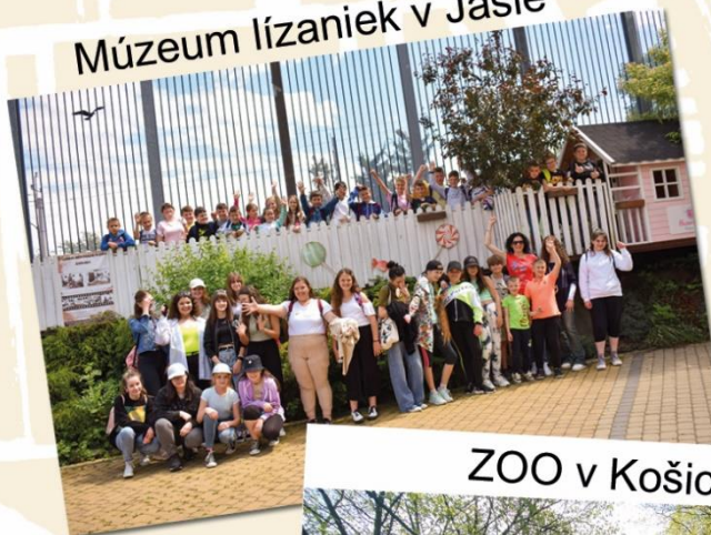
Múzeum lízaniek v Jasle