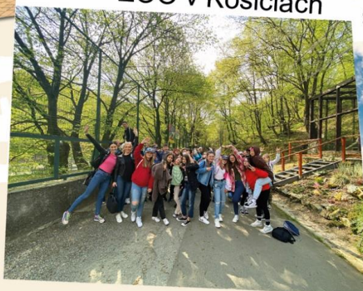
ZOO v Košiciach