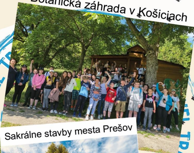
Botanická záhrada v Košiciach