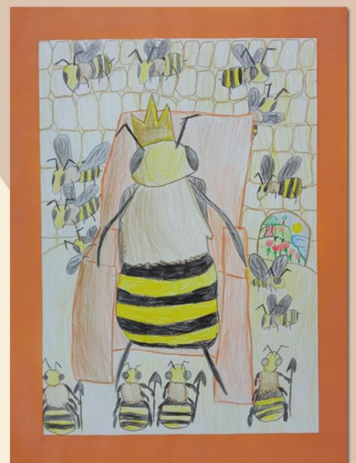
Šimon Jurčišin, III.A