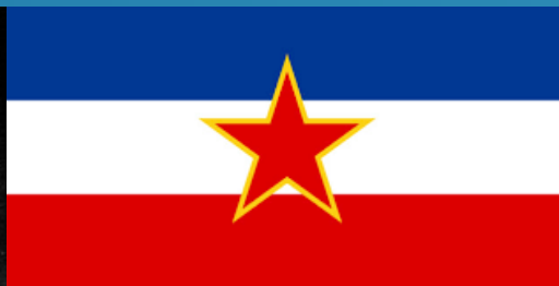
J. B. Tito = juhoslovanský diktátor, ktorého Stalin považoval za zradcu...