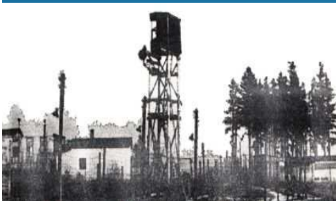
Pracovný tábor v Jáchymove – ťažba Uránu