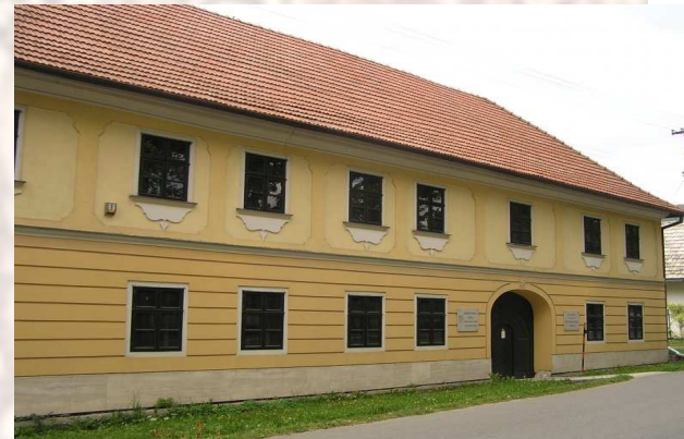
Kláštor pod Znievom – od 1869