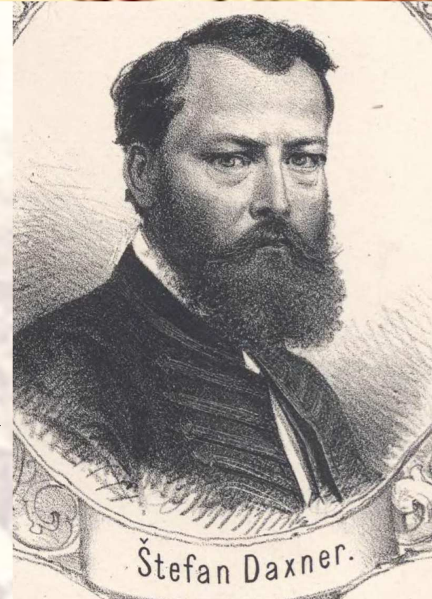
Štefan Marko Daxner – autor Memoranda