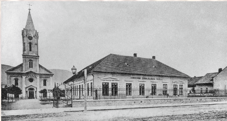
Martin – od 1867