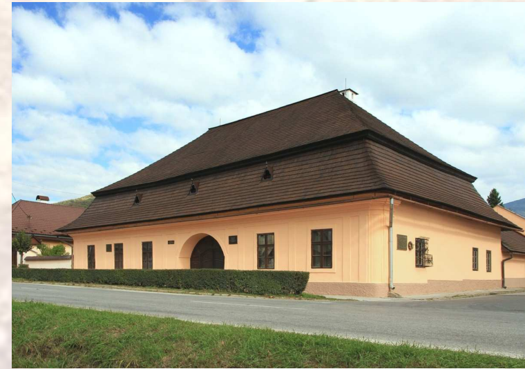
Revúca – otvorené 1862