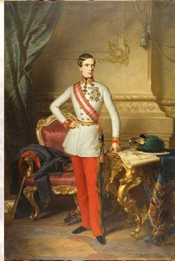
František Jozef I.

Memorandum Slováci predložili uhorskému snemu a neskôr ho doručili cisárovi Františkovi Jozefovi I. do Viedne – nesplnil všetko – len malé ústupky: