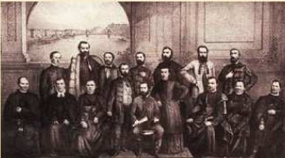
Členovia delegácie, ktorá predložila Memorandum uhorskému snemu

Slováci využili uvoľnenie situácie, aby naplnili svoje ciele: 6. a 7. júna 1861 sa v Turčianskom Sv. Martine konalo celonárodné zhromaždenie, na kt. bolo prijaté Memorandum slovenského národa (politický program).