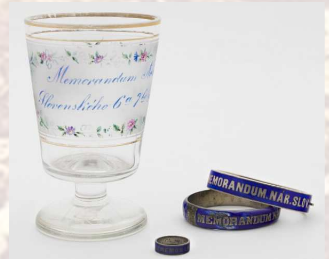
Memorandový pohár, prsteň a náramky/náušnice – pamiatky na významnú udalosť.