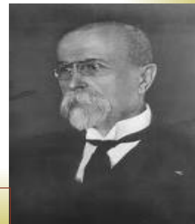
Tomáš Garrigue Masaryk

spolok, ktorý podporoval slovensko - českú spoluprácu a pomáhal Slovákovi kultúrne aj finančne