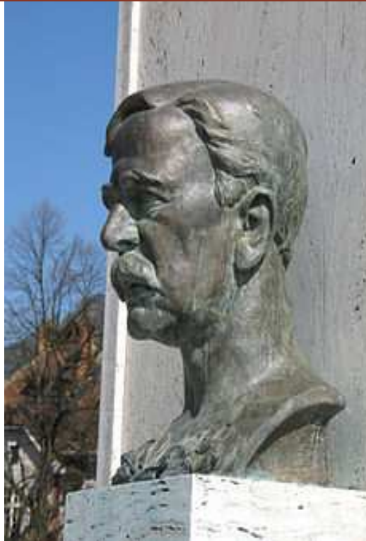
Robert William Seton-Watson

Britský historik a publicista zaoberajúci sa dejinami slovanských národov