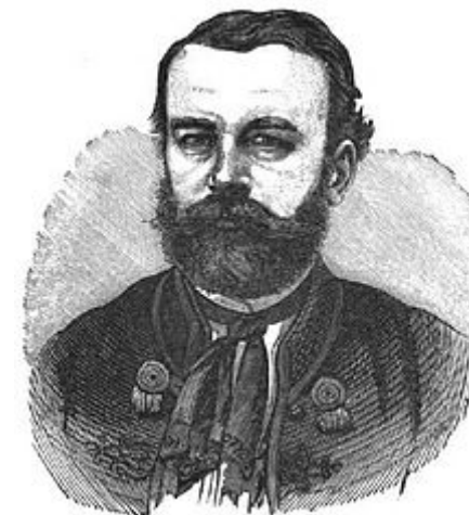
Viliam Pauliny- Tóth - prvý predseda SNS