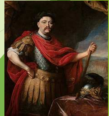
Ján III. Sobieski