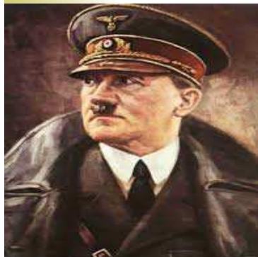
Adolf Hitler – monštrum II. svetovej vojny